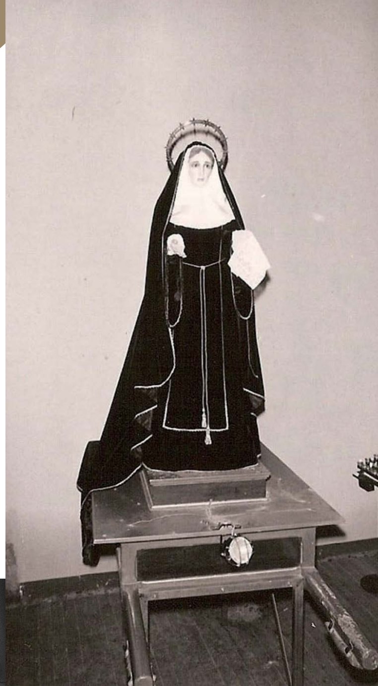
Nuestra Señora de la Soledad 1974

Cofradía del Santo Sepulcro y Nuestra Señora de la Soledad